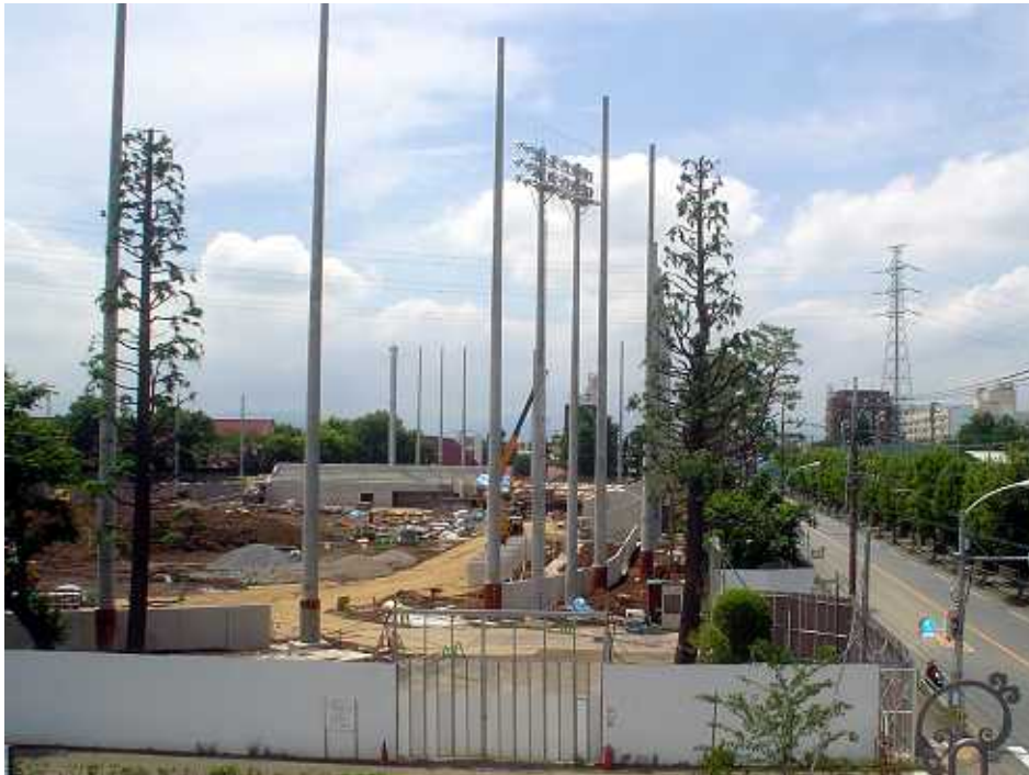
(上:内野スタンドやナイター用の照明などの整備が進む昭和公園野球場)

住所：郷地町3-8-9 ホームページ： http://www.akanuma.org