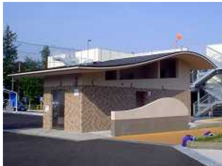
(左上:完成した立体駐車場、右上:リニューアルしたトイレ)